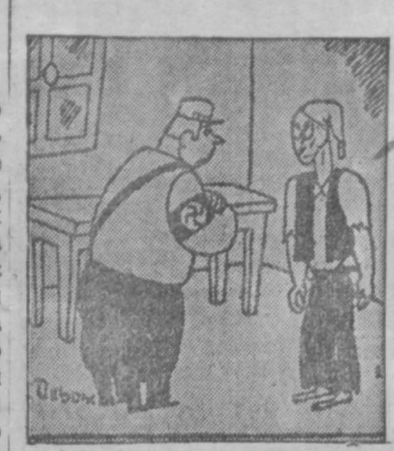
—Что? Хлеба? Да ты вы не знаете, что национал-социалистская революция иди чилась? (Юманите, Париж)