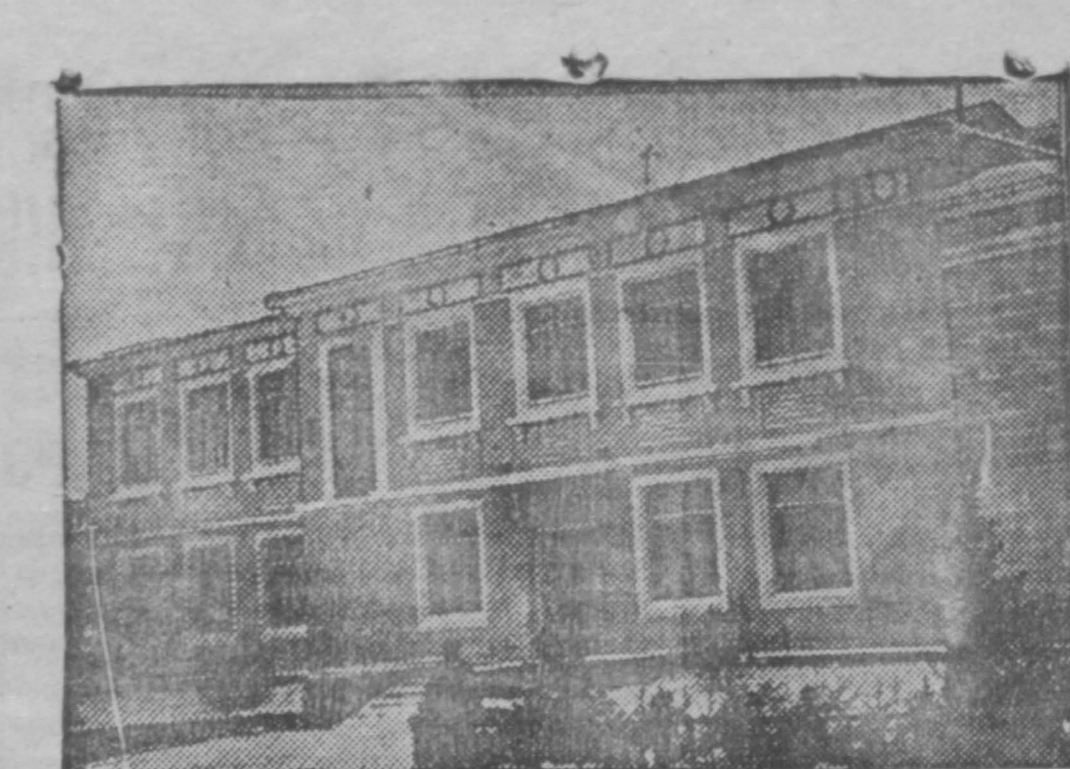
Новоустроенное здание делового клуба Кемеровокомбинатстрой

Привлечена телна Справиться: Коннозаводская № 28.