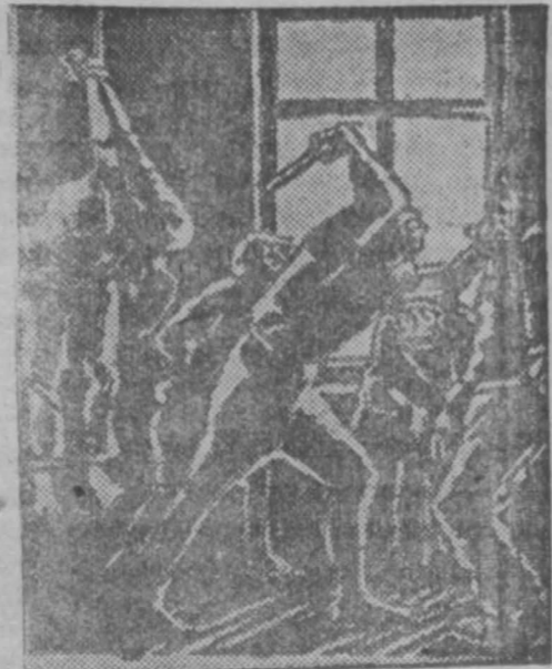
Картина „Третий Империя“ Как в Германии борются с коммунистической опасностью...