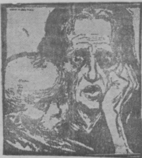
Нищета и голод пролетариата — неизменные спутники капитализма. Рисунок из «Молодой гвардии» центрального органа германского комсомола (октябрь 1921 г.)

Одним из главных «аргументов», выдвинутых против предложения Коминтерна о едином фронте, это