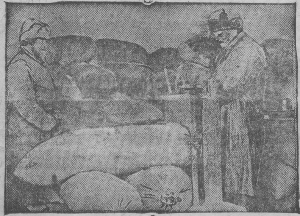
Приемка хлеба на складе Заготзерно. На фото: Колхозник из Мозжухинского сельсовета за сдачей колхозного хлеба.

Имеющиеся в прокуратуре данные говорят за то, что во многих сельсоветах Кемеровского района все еще имеет место проявление прямого саботажа в выполнении плана зернопоставок, особенно со стороны единоличников. Многие сельсоветы до сих пор не ведут решительной, беспощадной борьбы с попытками затормозить выполнение плана хлебосдачи — не привлекают виновных саботажников к ответственности по 61 статье УБ. В таких сельсоветах относятся: Кобылинский, Ягуновский, Мазуровский, Воскресенский, Ст.-Червоенский и др.