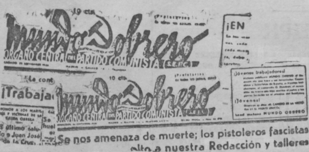
Орган испанской компартии 'Мундо обреро' со статьей т. Димитрова

В Саламанке вооруженные рабочие вступили в перестрелку с полицией. В деревне Саберо восставшие крестьяне сражаются с правительственными войсками. Всеобщая стачка продолжается во всей Испании. В Мадриде ходят только отдельные трамваи и автобусы с охраной вооруженных полицейских. Рабочие с исключительной дисциплиной проводят стачку наметая на улицах привидения. Только по официальным данным в Мадриде арестовано свыше 2 тысяч человек. Сегодня начинает заседать в Мадриде 62 военных трибунала, имеющих право выносить смертный приговор за политические преступления. Также же суды начали действовать в провинциях.