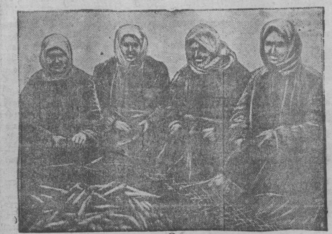
Ударницы колхоза „Пioneer“ за очисткой моркови перед ее закладкой в овощехранилища

В совхозе нет ни одного человека, который бы не устроил