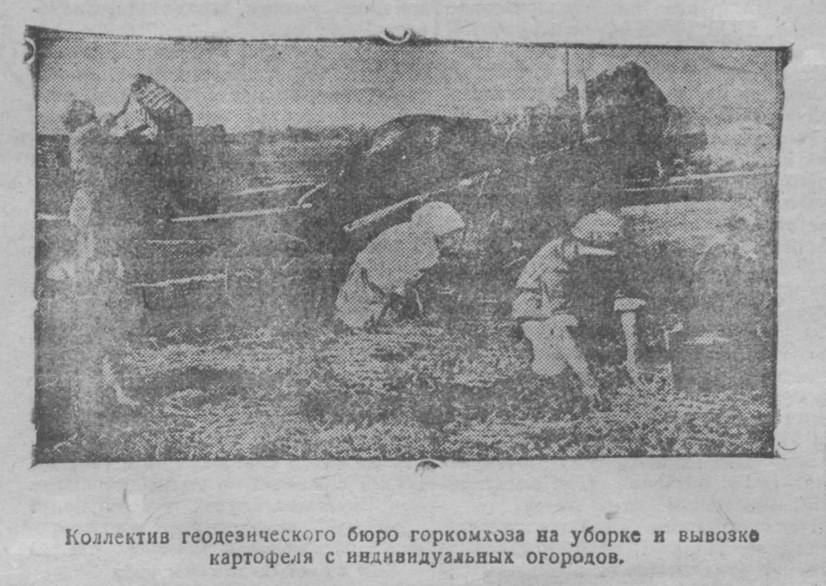
Коллектив геодезического бюро горкомхоза на уборке и вывозке картофеля с индивидуальных огородов.