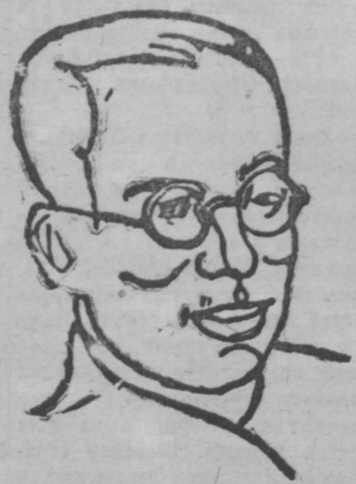
Японский писатель Хидзиката заезд в СССР и выступление на съезде писателей исключен из сословия писов. На снимке писатель Хидзиката.

Небольшие суда, находившиеся в более километра от берега, унесены в океан.