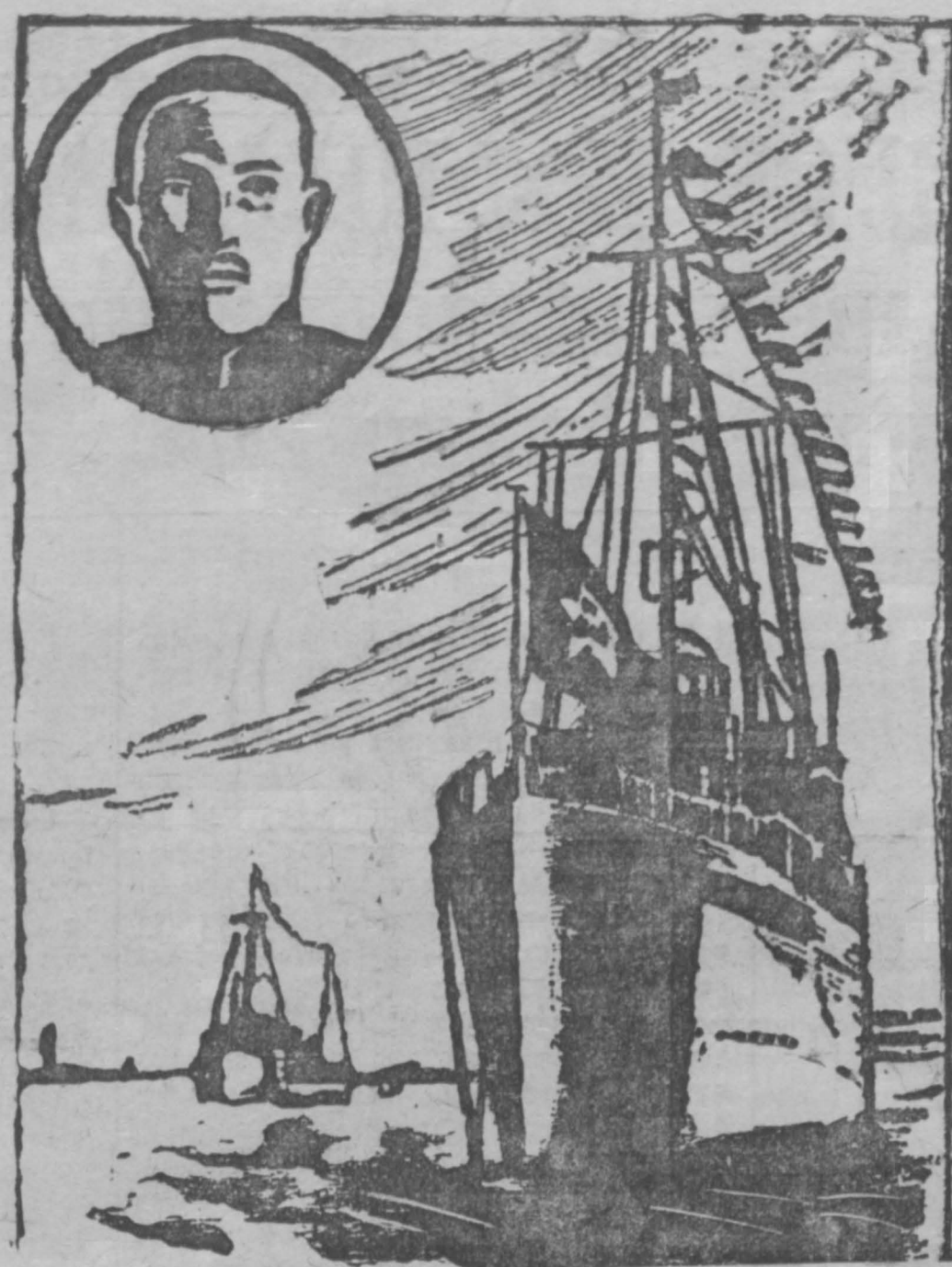
Советская эскадра вернулась из Гдыни в Кронштадт. На снимке: корабли «Калинин» и «Володарский». В овале—командующий эскадрой т. Галлер.

В 19 часов 25 минут народный комиссар по иностранным делам тов. Литвинов, встреченный продолжительными аплодисментами в ряде делегатских скамей, в местах печати и гостей поднимается на трибуну.