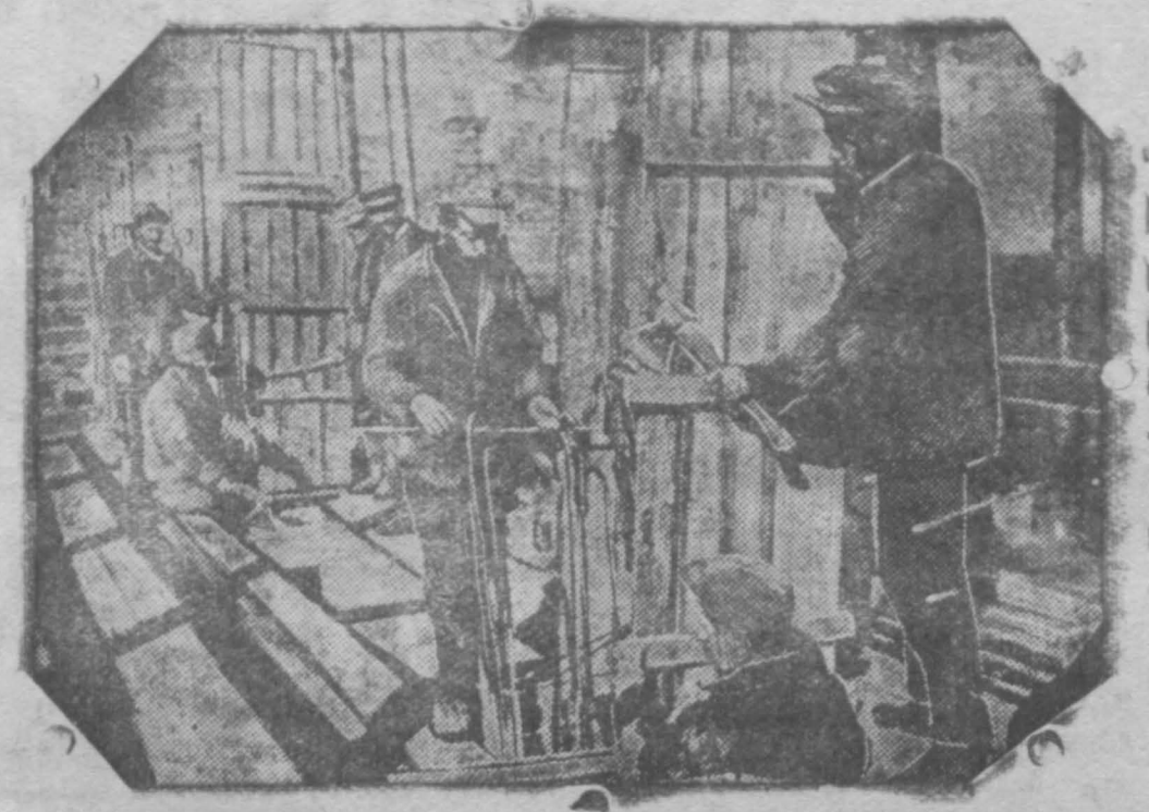
Ударная бригада Самсонова (Азотстрой) за установкой опалубки.

Сберкассами района выдано в кредит по 8 логерен Овощникам: в июле, августе и за половину сентября на 2223 руб. Центральной обертаской выдано вы-