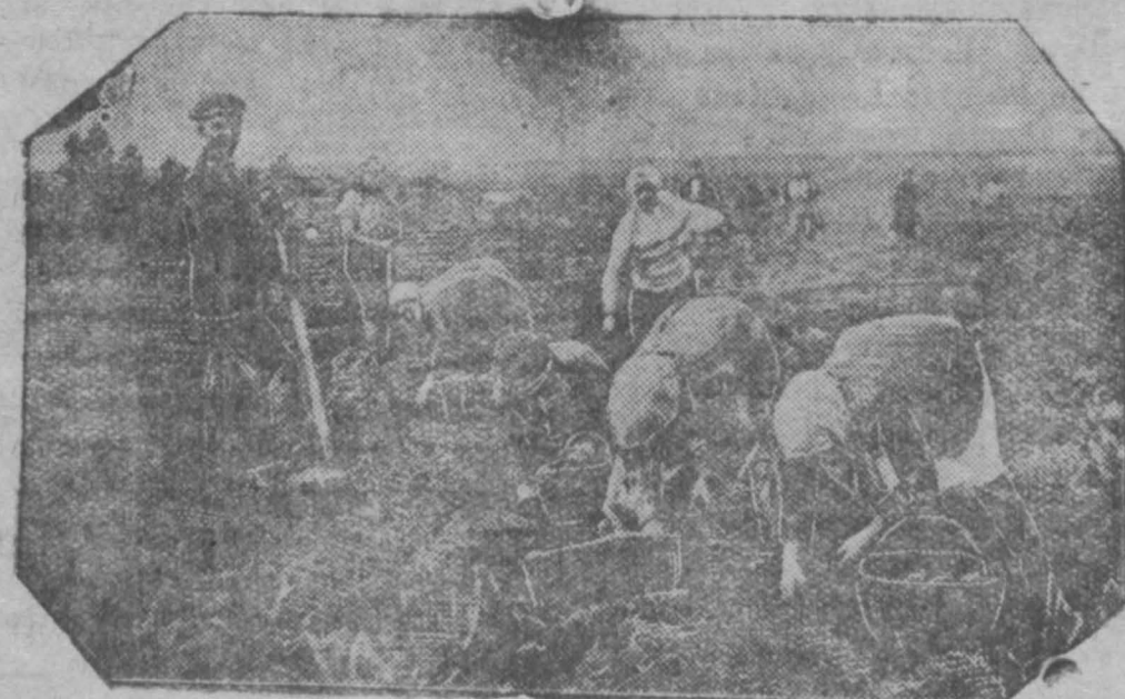
Уборка овощей на совхозкомбинате Кемеровского ЦРП