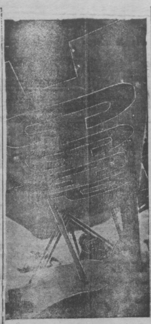
Если в здании от больницы совхозе или колхозе Хэрьковщины окажется больной, которому нужна будет срочная операция, можно будет вызвать санитарный самолет. По вызову хэрьковский здравпункт направляет туда дежурную санитарную машину.

НЬЮ-ЙОРК. В городе Феникс (штат Аризона) полиция, вооруженная дубинками, газовыми бомбами, напала на четырехтысячную демонстрацию безработных, требовавших увеличения пособия. В столкновении свыше 70 демонстрантов ранены, 23 арестованы.