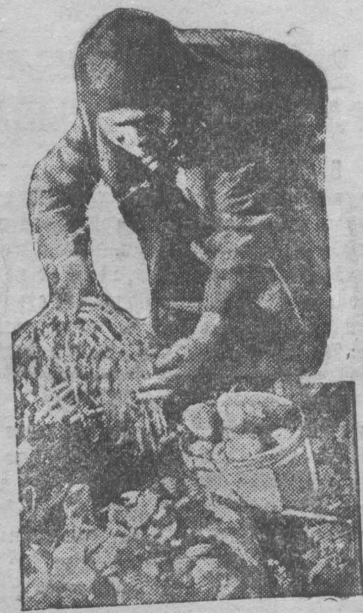
За уборкой картофеля