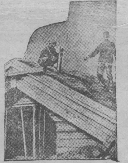
Ремонт озодекранилиц Запсибторга

Проведение пленума оперативной пятерки три субботника по