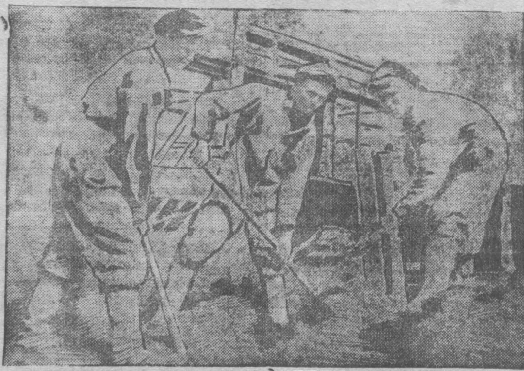
Ударная бригада землекопов за работой (Автострой).

3. Для повышения уровня партийно-массовой работы требуется в работе парткомов больше дисциплины, организованности и плановости. Каждый партком, секретарь парткома и партбюро должны иметь декадный оперативный план, отражающий основные моменты партийно-массовой работы.