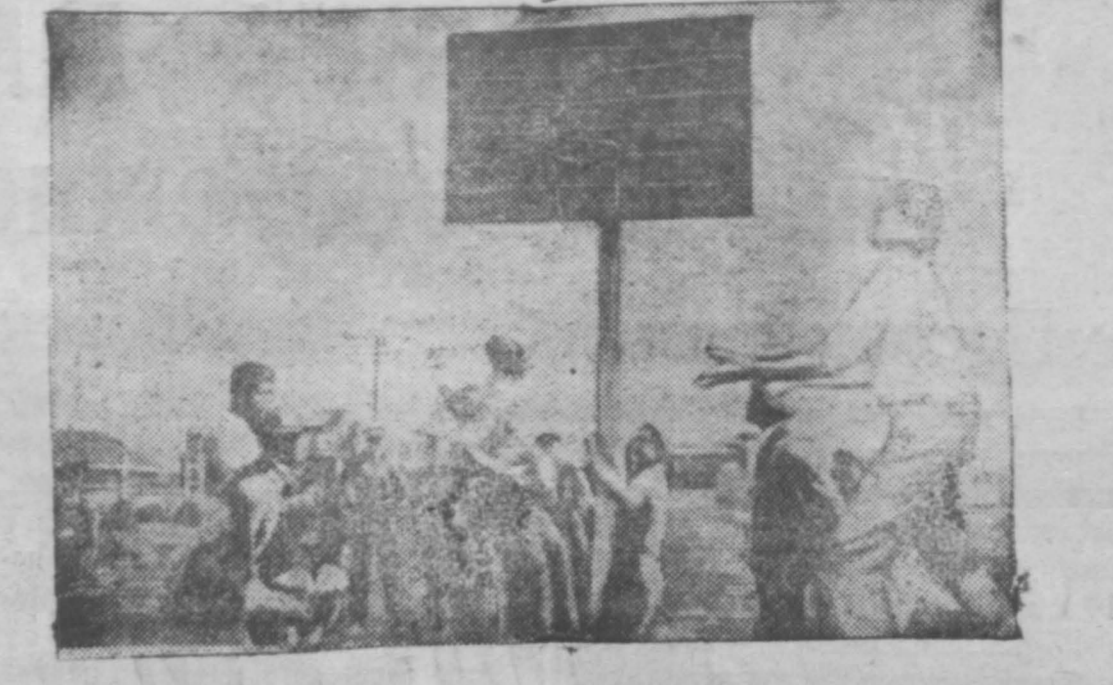
Нака уне открытия нового учебного года на стадионе состоялся праздник учащихся. На фото: один из моментов праздника, игра в баскетбол.

4-го сентября в 7 часов вечера в клубе КИС проводится конференция по начату проинформации рабочих милиции. (Доклад директора Кемпротекта Т. Зянов). Перед конференцией будет проведено ознакомление с проектными работами. Представительство на конференцию от посольства и завкомов от 20 человек 1 делегат и отделение по пригласительным билетам. Делегаты на конференцию проходят по удостоверениям завкомов, застройщиков; пригласительные билеты рассылаются. По окончании конференции художественная часть, будет поставлена комедия «Чужой ребенок». Кемпротект, Горомбит. Кемгостеатр (Дворец труда) 5 августа 6 августа Только два дня БОЛЬШОЙ КОНЦЕРТ Ансамбль баянистов братьев Онегиных Начало в 9 час. вечера Билеты продаются в кассе театра с 12 до 3-х дня и с 5 до 9 веч. При коллективных заявках скидка ГОРСАД кино ГОРСАД 4—сентября—4 Одна из художественных фильмов «СТАРЫЙ ЗАВОД» Начало сеансов 8—10 часов. Касса с 7 часов Анонс: Намидат в президенты