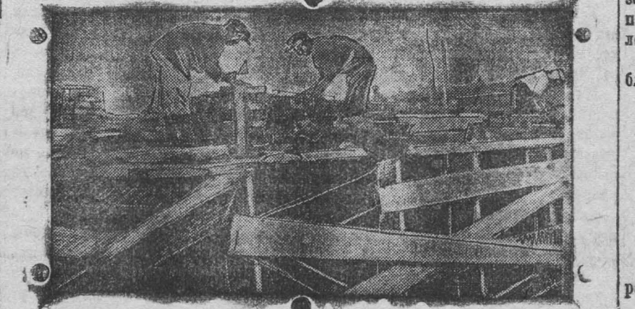
На кладке здания мойки фракций.

Партийный комитет, комсомол и профсоюз, учитывая всю ответст- венность стройки и образовавшийся серьезнейший прорыв в подготовке завода к пуску, должны принять самые энергичные меры к усиле- нию партийно-массовой работы, к развертыванию работы производст- венных совещаний.