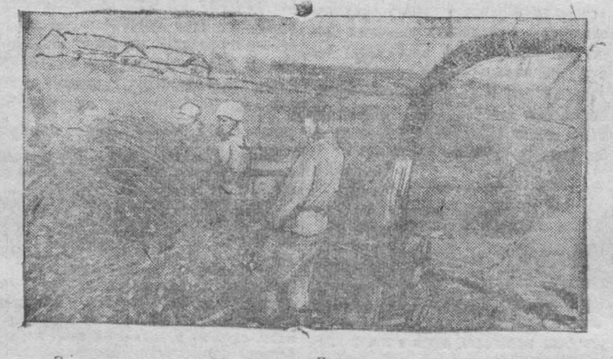
Заготовка силоса в колхозе им. Ленина.

Сейчас борьба за успешное проведение сенокосной кампании — есть боевое действие за осуществление решений июньского пленума ЦК ВКП(б) в области развития социалистического животноводства.