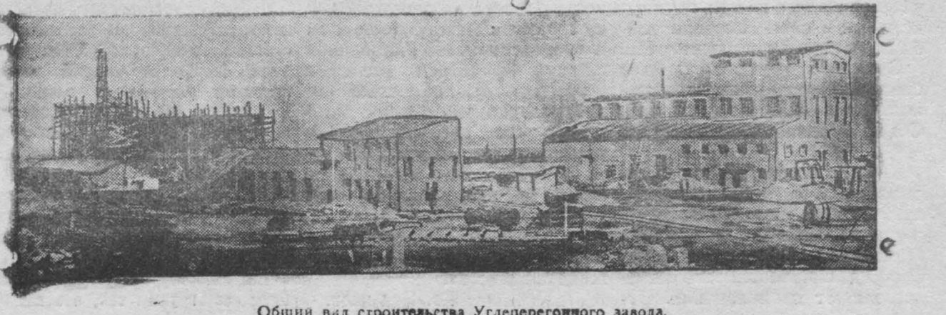
Общий вид строительства Углерегонного завода.