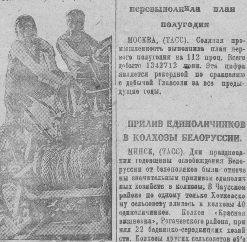
Тракторные и конные корчевальные машины применяются в совхозе Чашниково Солонечского района для раскорчевки участков, намеченных под посев.

КИЕВ, (ТАСС). К 10 июля колхозы Украины подыали 2238900 га чистых паров — 104,1 процент плана. Единичный сектор выполнил задание всего на 60,2 процента.