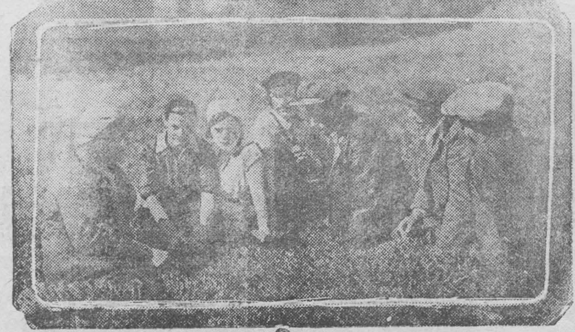
1. проработка решений июньского пленума ЦК ВКП(б) среди животноводов—Центральной фермы Сельхозкомбината УРСА Кемкомбинстроя.