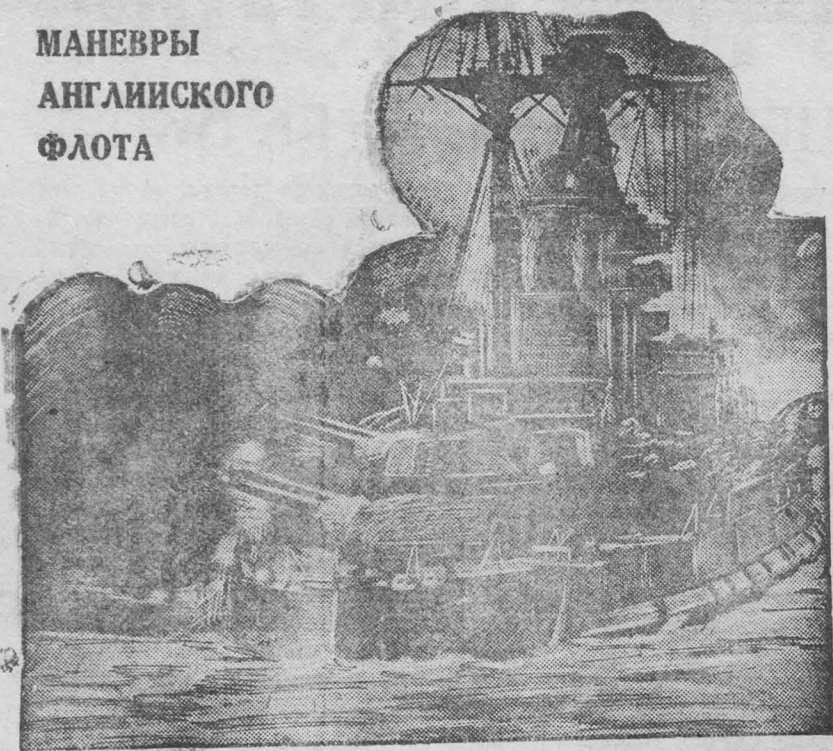
4 и 5 июня состоялись большие маневры английского флота. НА СНИМКЕ: Бортовой зал дредноута „Мелейя“. Его производят одно временно 8 пятнадцатидюймовых и 6 шестидюймовых орудий