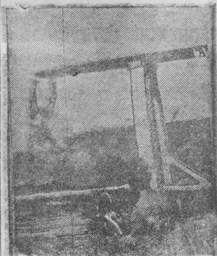
Водный спорт все более и более внедряется в широкие массы трудящихся Кемерово. Водную станцию «Динамо» ежедневно посещают сотни трудящихся. На снимке: Прыжок в воду с трамплина водной станции «Динамо».

В июле Запсибторг получает на 600 тысяч рублей трикотажных, галантерейных, обувных и парфюмерных товаров, в том числе мануфактура на 150 тысяч, готового платья на 43 тысячи и обуви на 5 тысяч рублей.