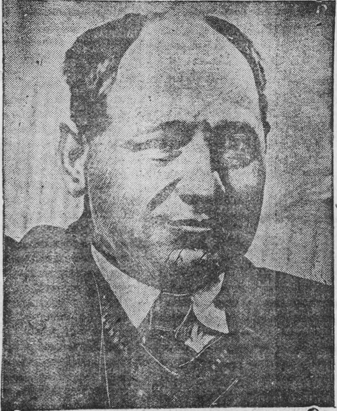
Конструктор агит-самолета «Максим Горький» — заслуженный деятель науки и техники СССР — А. Н. ТУПОЛЕВ.

А самолет-гигант строится на ЦАГИ — уверенно и быстро.