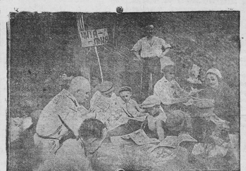
Читальня в бору.