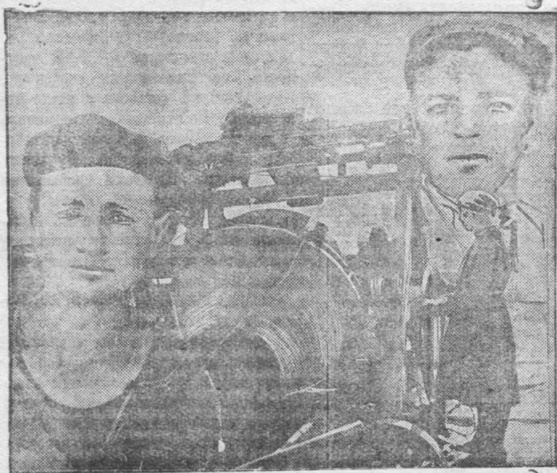
Бетономешалка «Егер» (Цинкстрой). В овале лучшие ударники Цинкстроя