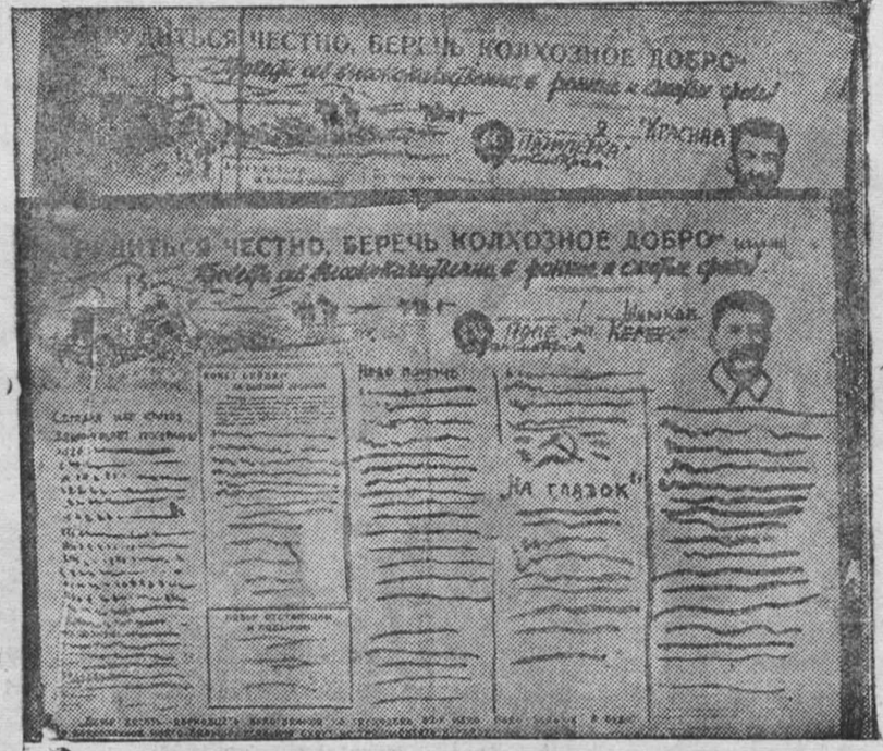
Бригадные стенгазеты колхозов «Красная пятилетка» и «Широкое поле» — лучшие по оформлению

Дальнейшая задача всех бригадных стенгазет в том, чтобы на опыте передовых, еще успешнее развернуть большевистскую борьбу за образцовое проведение сенокосной и хлебоуборочной кампании.