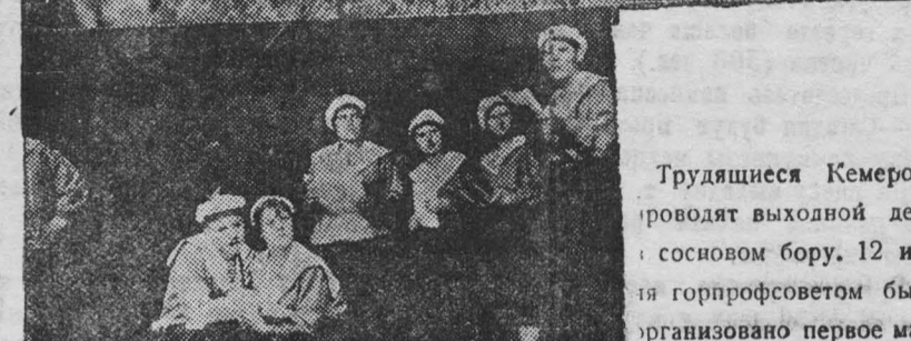
Трудящиеся Кемерово проводят выходной день в основном бору. 12 июня горпрофсоветом было организовано первое массовое гуляние в бор.