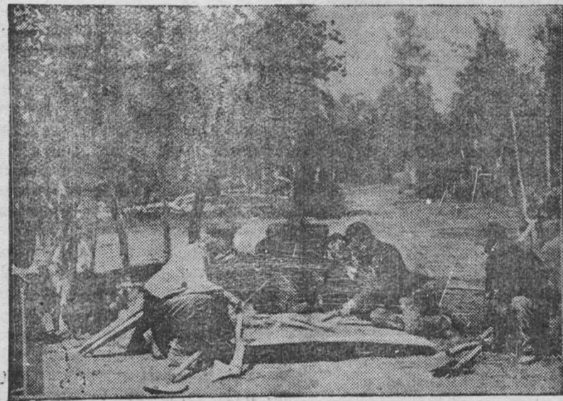
Техническое руководство строительства участка № 1 знакомится с чертежами на строительстве нового объекта

Пилосес—это тот самый строймастер, из-за недостатка которого десятки часов простаивают квалифицированные плотники, тем самым не обеспечивается выполнение плана.