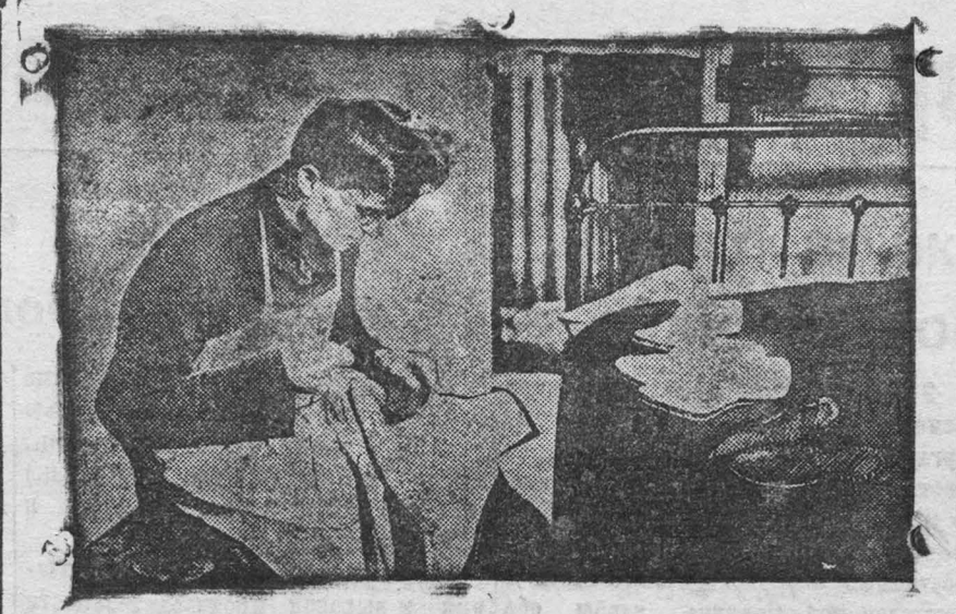
На снимке: французский студент-медик зарабатывающий себе на жизнь ремеслом сапожника