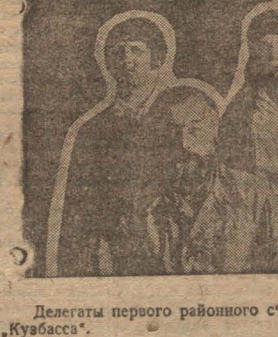
Делегаты первого районного съезда колхозников-ударников—колхозники Кuzбасса.