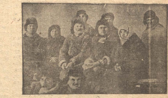
Лучшая ударная бригада г. Федотова (Кокострой).

Социалистическое задание литейщиками будет выполнено.