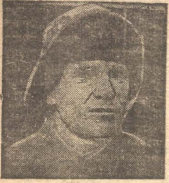
Кольдебеков—сменный инженер, организатор сменно-встречного планирования.