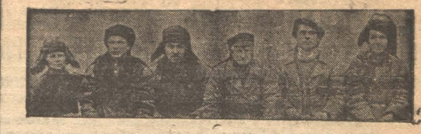
Ударная бригада Кузора—строители ТЭЦ. Выполнившая декадный план на 110 проц.

СССР располагает огромными запасами магния и бериллия. Бериллий и их разновидности—наумудры и окванария имеются у нас на Урале около Свердловска. Это дает возможность нашей стране раньше других овладеть широким применением сверхлегких магнитных сплавов в промышленности (ЦНТЭИ-СО).