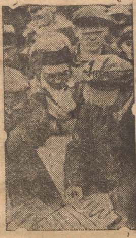
Суховские колхозники «Искра-2» подшивают междубригадный содоговор.