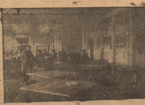
Зал столовой № 6 Кузбасстрой. В этой столовой, в результате похода за вкусный обед, введена дисциплина, что улучшило обслуживание столоующихся, ликвидировало очереди.