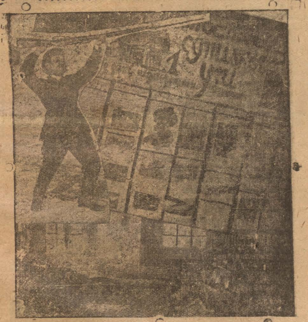
На Кокострое хорошо поставлена культурная работа среди рабочих-казачков. На снимке: внутренний вид казачьего барака, (чистоте и уюту барака могут позавидовать рабочие многих барачков). Комсомолец-казак за военной учебой. Стенгазета на казачьем языке.

4-го апреля в 6 часов вечера в Дворце труда — горпрофсовет комната № 12 — созывается совещание