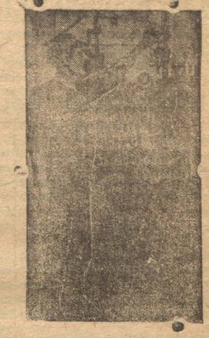
Бригада Старухина в котельной химзавода выполняет свои задания на 100 процентов. На снимке бригадир Старухин.

Бригадир 13 рабкорской бригады Тимофеев — почетный красноармеец №-ского батальона.