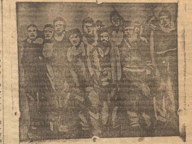
Узник Скотсборо, осужденный американским буржуазным судом к казни на электрическом стуле.

Сегодня—в день Парижской коммуны парт. и профорганизации коксохимкомбината, подводя итоги интернациональной работы среди рабочих, должны сказать также и о работе среди тех наемных—рабочих, которым Октябрьская революция дала одинаковые права со всем рабочим классом СССР и которых на строительстве комбината насчитывается сотни. Особенно надо остановиться на работе среди наемных—казанок, против которых издавна была организована классовым врагом травля и дикое посяление.