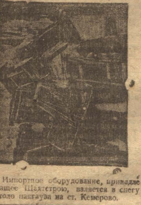
Импортированное оборудование, принадлежавшее шахте Шмаков, в настоящее время находится на ст. Кемерово.

согласилось с мнением рабочих и технических работников о переборке врубовой «Джефри» на подготовительные работы Диагональной шахты. 16 марта врубовая вывезена «на гора». Студентами-практикантами организован воскресник по ремонту, чистке врубовой. На днях врубовая «Джефри» будет спущена в основной штрек Диагональной шахты. Гринш В марте крепящий лес вывезти из Журавловской гавани На Журавловской гавани более месяца идет заготовка леса. Весь лес шахтовый, крепящий и распилочный, в большинстве сухой. Леса заготовлено более 20 тысяч кубометров, который необходимо вывезти до распутицы, т. е. лона хорошая дорога и лесотаске лесозавода. Для этого нужно мобилизовать всю конную силу города, Нем рудника и дер. Кемерово. Не следует доводить до того, когда невозможно будет ехать ни на санях, ни на телегах, как это было в прошлом году. Если лес не будет перевезен в марте, то он останется под угрозой быть унесенным разливом. Павлов