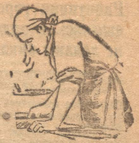
Повар Замлынская в столовой № 1 мехзавода, обязавшаяся добиться наибольшего повышения качества обедов из имеющихся продуктов.