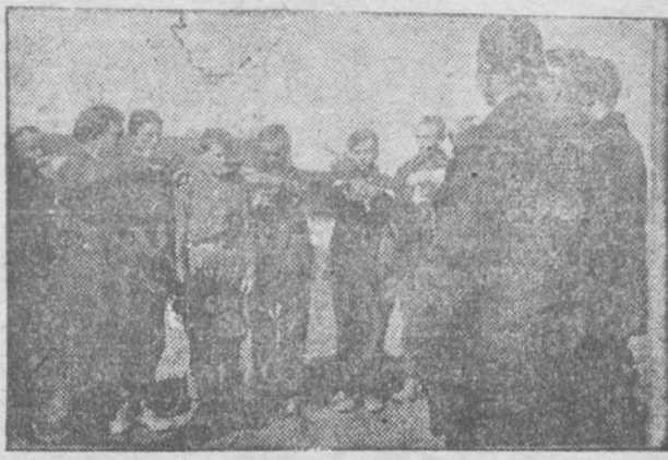
Учащиеся Кемеровской школы горпромуха на военных занятиях.

Кризис в капиталистических странах обрекает десятки миллионов рабочих и крестьян на голод, нищету и вброджение. В Стране советов успешно заканчивается первая пятилетка, ликвидирована безработица, растет материальный и культурный уровень трудящихся. Долой капитализм! Да здравствует социализм!