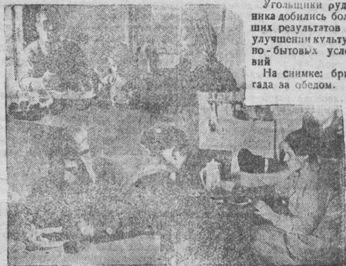
Угольщики рудника добились больших результатов в улучшении культуры бытовых условий. На снимке: бригада за обедом.

ты пятилетки. До пуска величайшей в Сибири электростанции остались считанные дни. Не за горами то время, когда рабочий класс, не только Сибири, но и всего Советского союза будет свидетелем того, как Кемеровская ТЭЦ даст первую волну электрического тока на рудники Кузбасса. Остались считанные дни до пуска в эксплуатацию второго Боксхимического завода, вместе с которым войдут в строй новые металлургические заводы, новые домны, новые прокатные станы.