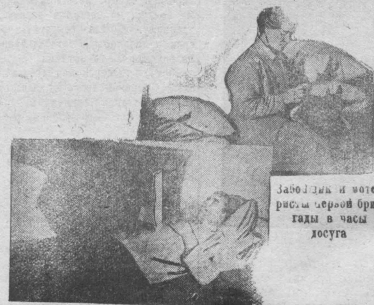
Забойщик и мотористы первой бригады в часы досуга

Рабочие угольщиков! Страна ждет от нас резкого перелома в добыче угля. Превратим угольные районы из отстающих в передовые участки социалистического строительства.