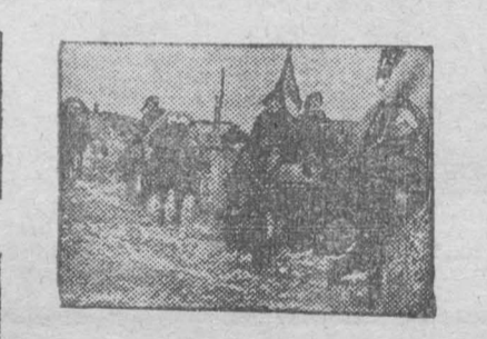
Красный обоз с хлебом колхоза „Красная пятилетка“, Березовского сельсовета.