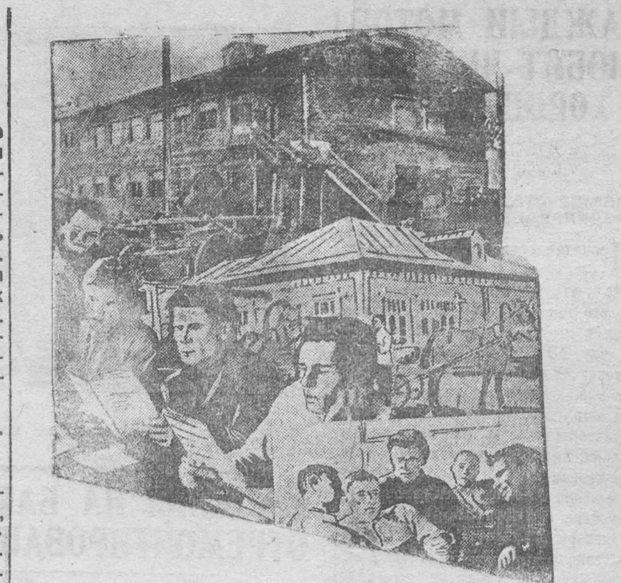
НА СНИМКЕ: Вверху—заседание для приехавших на ярмарку колхозников на Циньцзян. В центре—заседание для колхозников по 2-й Октябрьской улице. Внизу—колхозники отдыхают в общежитии.