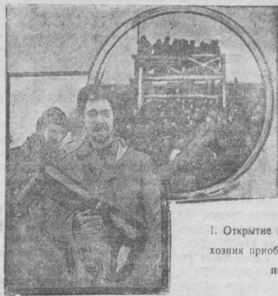
1. Открытие ярмарки. 2. Колхозник приобрел на ярмарке пшеницу

Все — колхозники, единоличники и трудящиеся должны твердо давать отпор подобным вывладам классового врага — спекулянта. Яс.