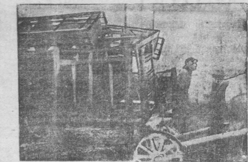
На СНИМКЕ: Цивильной проезд кровати, этажерки и табуретки на колесную яремку.

Еще в прошлом году стоял вопрос перед ТНБ об установлении за