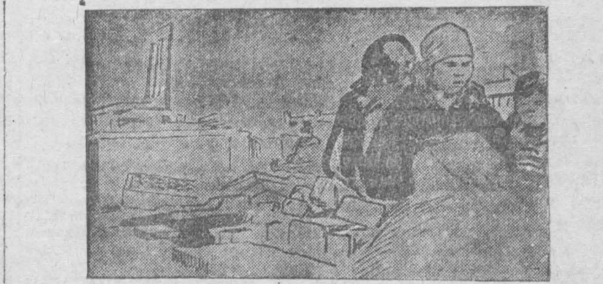
Торговля с лотков на колхозном базаре Лоток „Коксовика“ торгующий товарами ширпотреба.