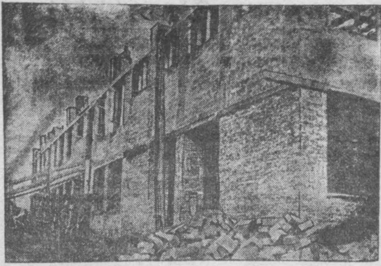
Здания строятся по договору к 1 декабря должно быть готово. Сегодняшние темпы строительства не гарантируют окончания постройки в срок.