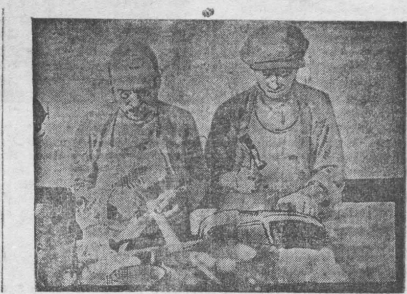
НА СНИМКЕ: Реставрация старой обуви для продажи на колхозной ярмарке. Спокойный цех промартеля «Трудовой путь».

прихода в цех бригады редакции «Кузбасс» о решении пленума по ширпотребу рабочие наши не знали.