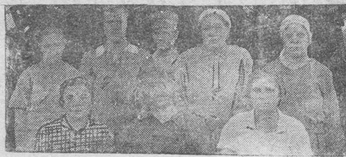
НА СНИМКЕ: Коллектив столовой шахты «Пионер», допустивший развал работы столовой.