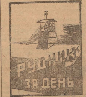
Во всех шахтах рудника за 26 июля добыто угля 1229 тонн—71 процент за яния.

В печи № 25 на юге Кемпласта также нужна перекрепка. Печь эта служит запасным ходом, а поэтому требует особого внимания.