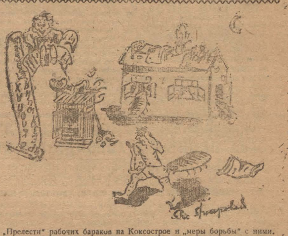
„Прелести“ рабочих баракoв на Коксострое и „меры борьбы“ с ними.

—Куда итти?—постоял, постоял и решил ждать утра. Дождлившие утра схватил ведро и побежал к водопроводу. Нет воды. —Черт их знает, никогда воды не бывает,—ругаются домохозяйки и работницы. —А часто тут так бывает? —спрашиваю. —Да почти изо дня в день. При мо беда,—сокрушено, отвечает по жилая работница. Иду в кинотягу... черт... и там нет воды—так и ушел ни с чем. Жутоко. Неужели здесь ничего не знают о 6-ти условиях тов. Сталина? Где постройком, санитаром? Г. Кутонов От редакции: Идем от застройщика Коксостроя сообщить, что он предпринял в области выполнения реш. 9 с/з-ба до профсоюзам о культурно-бытовых условиях рабочих.