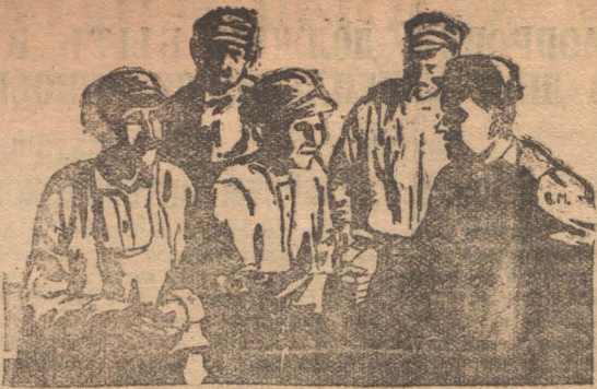
Лучшая хозрасчетная бригада плотников Кузора (ТЭЦ).

Рабочие и техперсонал 3-го участка вызывают другие участки Кемжилстроя последовать их примеру и провести такой же «ударник». Это будет хорошим образом завершения проводимого штурма. Ф. Захаров.