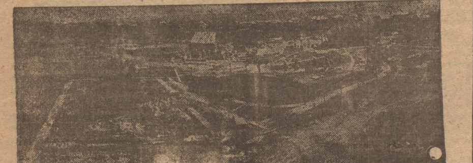
На углу Пролетарской и Тельской улиц производится закладка двух зданий школ ФЗУ ФЭС. На снимке — земляные работы.

Этот организованный поход против рабочих должен привлечь к себе внимание профорга. А.