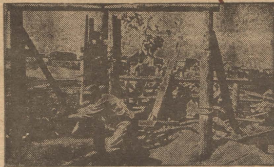
Работы водоснабжения по Гинерской улице.