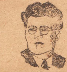
НА СНИМКЕ: Академик И. М. Губкин.