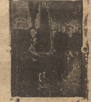
Делегация краснознаменной провурской базы.