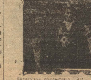
Делегация коллектива ВЛКСМ