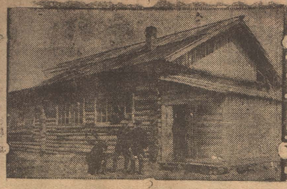
Крольчатник Промсоюза. Внешний вид.