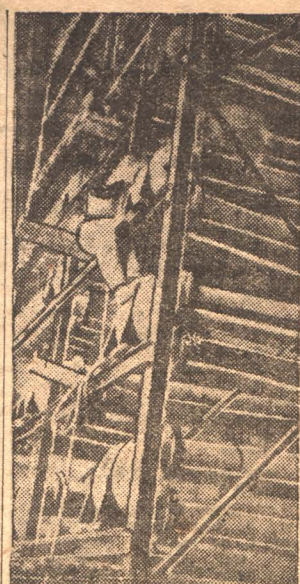
Начало оборудования холодильных ком на Кокострое.

Таким образом, спуская часть дробленного угля в шихту один де