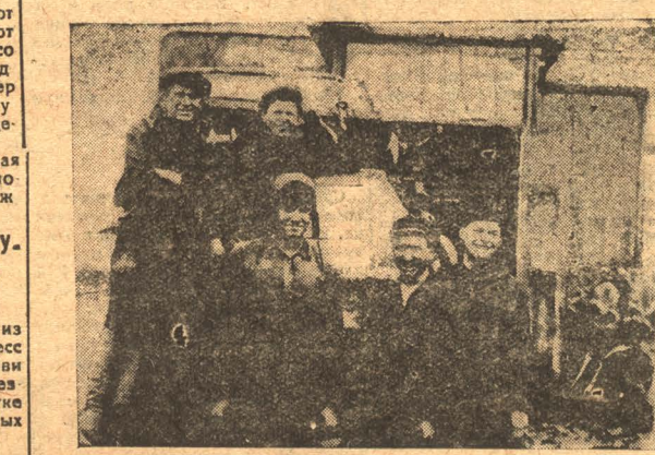
Школа ФЗУ химзавода выпустила 7 человек, перешедших на производство. НА СНИМКЕ: Выпускники на производстве.