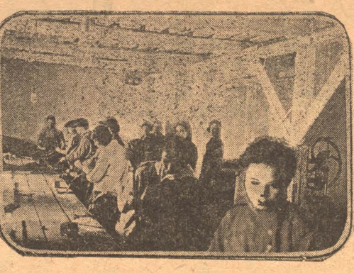
НА СНИМКЕ: Слесарная мастерская горпромуша Ленрудника.