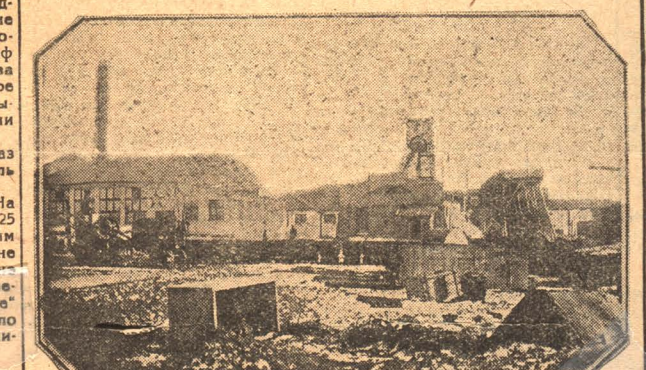
НА СНИМКЕ: Емельяновская шахта в Ленинске.

То, что „мы вперед!“—это много заслоняет глаза при оценке правильного конкретного положения.