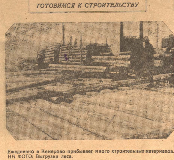
Ежедневно в Кемерово прибывает много строительных материалов. НА ФОТО: Выгрузка леса.

В апреле месяце по Кузнецкому округу будут организованы курсы по подготовке безработных подростков в школы ГЛУ, ФЗУ и Стройуче. Общее количество учащихся на этих курсах будет составлять минимум 800 чел. По отдельным районам количество курсовых распределено таким образом: в Ленинске — на 150 человек, в Кемерудине — 30 чел., химзаваде — 150 чел., в Прокопьевске — 170, в Кузнецком — 100, на Цинкзаводе — 100 и в Гурьевске — 50 чел. Срок обучения установлен в пять месяцев. На содержание курсов предполагается затратить около 40 тыс. рублей при обязательном участии Сибудга, Кузнецкостроя и Цинкостроя. Президиум окрпрофбюро решил обязать окрком в срочном порядке предоставить школьные помещения для курсов, оборудовать в них кухни для горячих завтраков и обеспечить необходимым кадром преподавательского состава. На курсы будут приниматься в первую очередь дети рабочих и служащих, при чем, не менее 50 проц курсантов должно быть заворожено из детских домов.