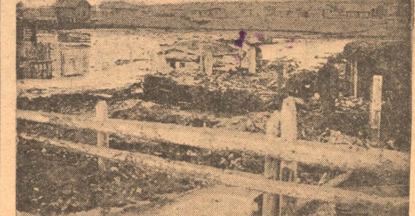
НА ФОТО: Место, где будет строиться щеголовский дом советов. Сейчас на этом месте лишь полуразрушенные хибарки и груды строительных материалов.