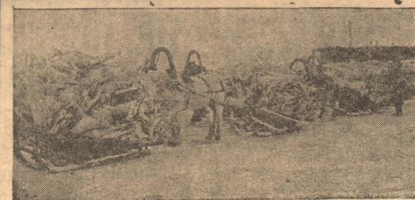
Перевозка баранины из жел.-дор. пакугаза