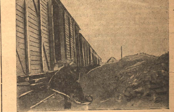
Из-за несвоевременной подачи угларок химзаводу кокс из печей приходится валить на отвал. Когда поступают угларки—кокс приходится валить на отвал, а в грунты для отправки на фото: Погрузка кокса, сваленного на отвал, в угларки