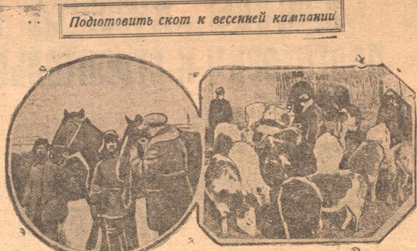
Подготовить скот к весенней кампании