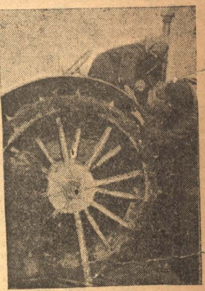
НА СНИМКЕ: Женская бригада в совхозе "Гигант" за ремонтом трактора.