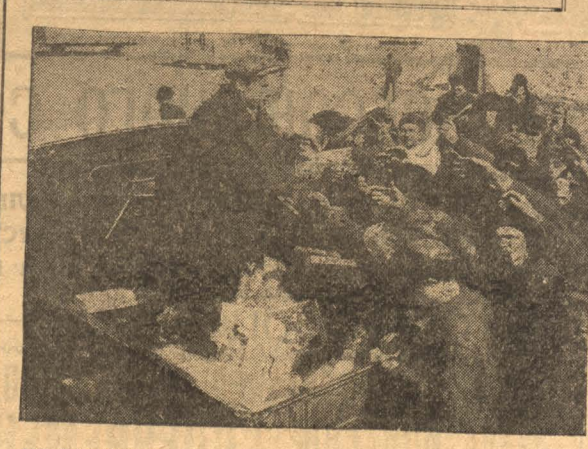
НА СНИМКЕ: Молодежь 8-го участка получает музыкальные инструменты от культ-бригады Наркомпроса.