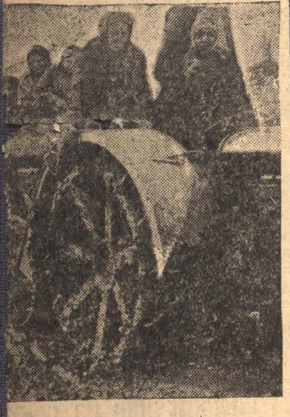
НА СНИМКЕ: Колхозники-трактористы с Снежки выезжают на пробный посев.

Потом начались мирные переговоры, дипломатическая переписка, согласования, уязвления; а гравий продолжал оставаться на месте. Он нем в пылу боевых и дипломатических схваток забыли. А те 4 тысячи гравия и песка, которые цинк-