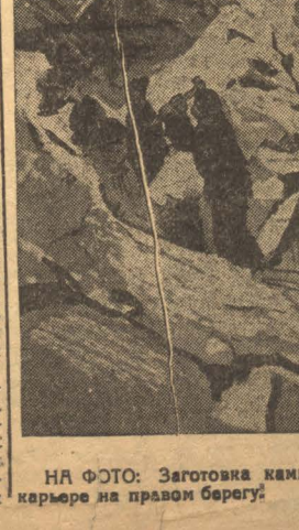
НА ФОТО: Заготовка камня в карьере на правом берегу.