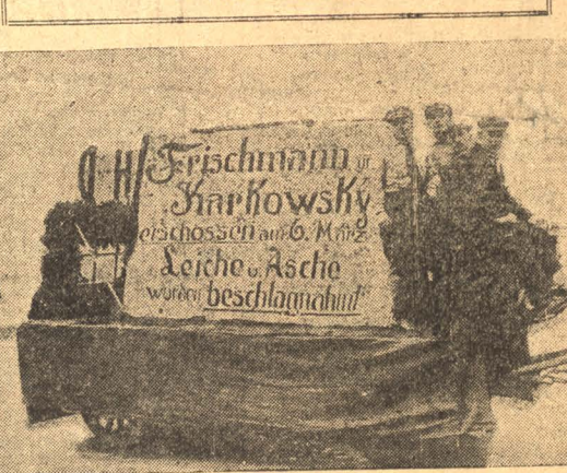
НА СНИМКЕ: Катафалки, на котором вместо тела и праха погбших товарищей, конфискованных полиции, помещен транспарант с надписью: "Фришман и Карковский были застрелены 6 марта. Труп и пепел были конфискованы полицией".