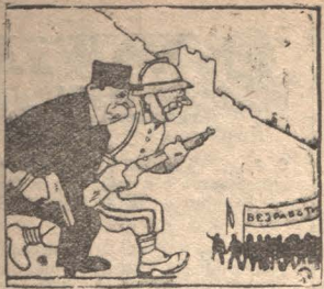
Всякая рабочая демонстрация будет расценена.