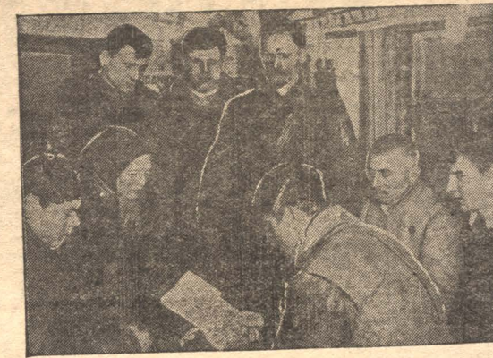
Правление колхоза «Новый быт» (Косовский округ ЦЧО) разбило всех колхозников на бригады и обязало бригадников изучить свой производственный план.

На снимке: Бригадир знакомит свою бригаду с планом сезона.