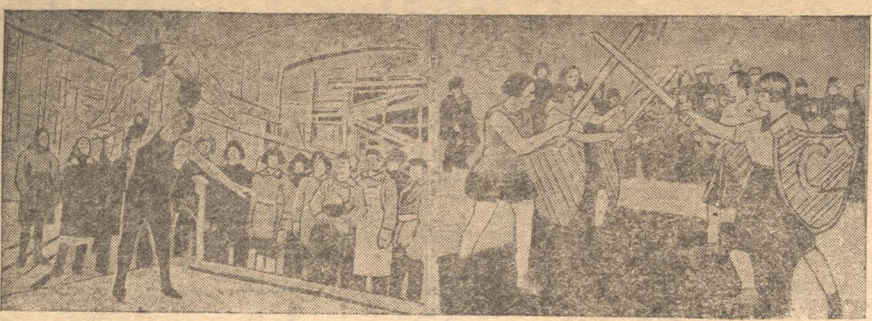
НА СНИМКАХ:—Физкультурники химзавода выступают во время обеденного перерыва на производстве.