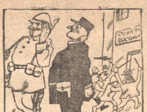
Поповско-фашистские демонстрации против СССР. — Исключение. (Карикатура из газеты американской компартии «Дейли Уоркер»).