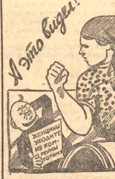
А это выгода?

В потребкооперации дело обстоит не лучше. В сырьевом складе мясо лежит вместе с утильсырьем, кожи валяются как полено. Сильно выветрено в кулах среди двора и сырью погуды в валке грязь и антисанитария. Рабочие товаров производят неправильно, бывают случаи больших наводок. Санитария комиссия ни разу в ладу не заглядывала. КОМИССИЯ.