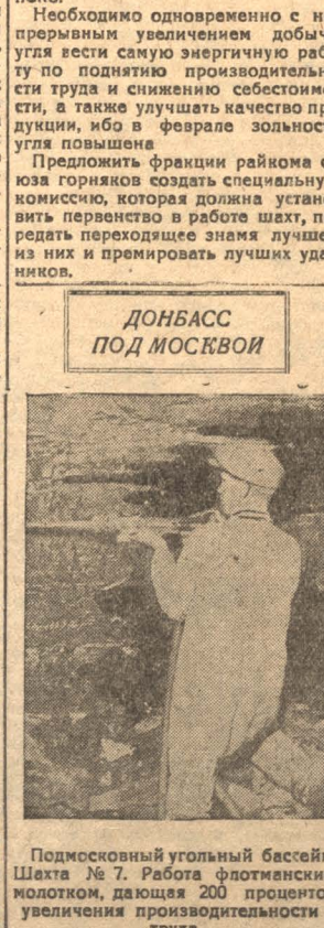
Подмосковный угольный бассейн. Шахта № 7. Работа флотинским молотком, дающая 200 процентов...