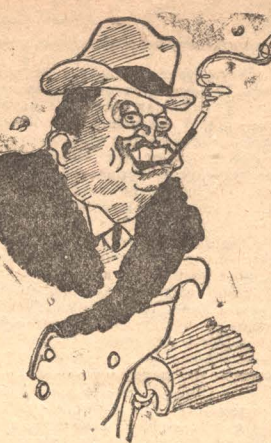
А. ТАРДЬЕ. Глаза французского правительств. Один из главных врагов Советского союза

Несколько шахтеров Ленинского рудника вот уже несколько дней чувствовали себя по-новому. Молодой дьявол солнца, ласковое улыбало белоглазые березы, шахтеры шутили глазами, и радостные, но нежного тревожного улыбки не скрывали с их лиц. По вечерам, окончив упряжку и вымывшись в бане, они собирались в проселочной квартире своего старшего и долго и горячо обсуждали, как должен работать коммунист, как он должен вести себя. Высказанные правила приехали к собственному труду и поведению, и находили, что ведут себя и работают, как надо.