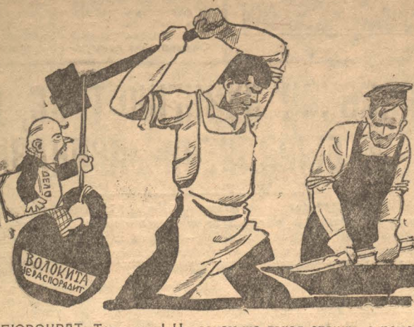
БЮРОКРАТ: Товарищи! Ну зачем же такая спешка с ремонтом машин?...