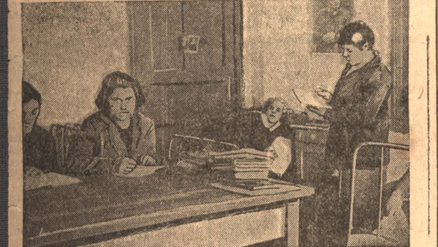
Студентки индустриального техникума в общезиме.

Всем пайщикам Кемеровского ЦРК, всему неинтересованному населению ДОРОГИЕ ТОВАРИЩИ! В течение марта органы управления Кемеровского ЦРК будут отчитываться перед широкими массами членов-пайщиков в своей работе за истекший хозяйственный год.