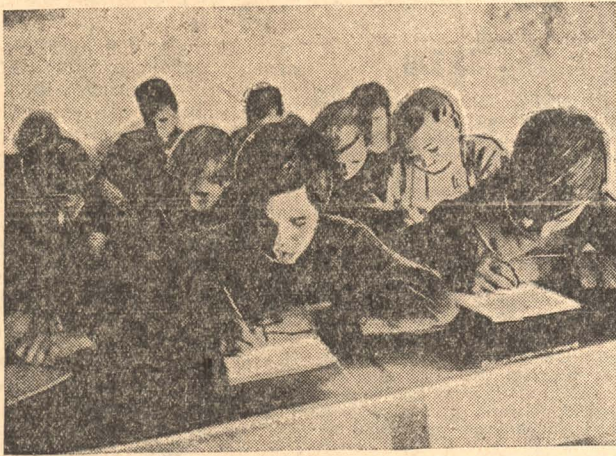
НА ФОТО: Дети коммунаров колхоза „Индустрия“ (Ленинский район) в школе за учебой.