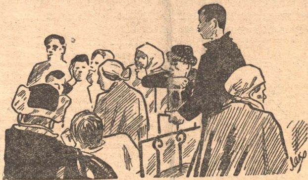
Делегаты окружной батрацко-бедняцкой конференции в общежитии

Железная дорога систематически прерывает по- дачу угларок под кокс и обрывает коксовые печи на простой. В январе и за 23 дня февраля коксо- вики простояли 93 часа 30 минут. Потеряно 3200 тонн кокса. Каждый час простоя приносит заводу 135 рублей убытка. Мы, ударники, требуем экстренного совещания, которое бы обсудило способы — как прекратить перебои в доставке угларок